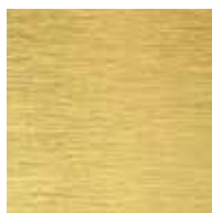
Ottone spazzolato Brushed brass