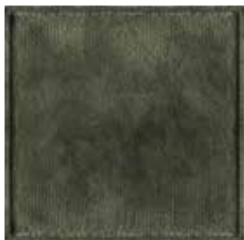
Verde Bosco Forest Green