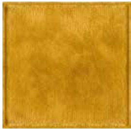
Senape 1513 Mustard 1513