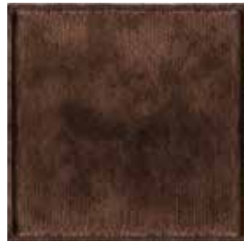
Cioccolato 1517 Chocolate 1517