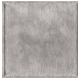
Titanio 1510 Titanium 1510